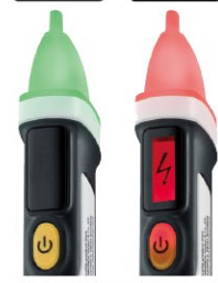
明瞭LEDインジケータ