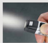
暗所でも便利なライト機能