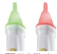
明瞭LEDインジケータ