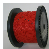
〔温度感知線/ボビン巻〕