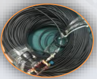
AHD™ Coaxial cable 200M