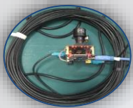
LVDS Cable 25M